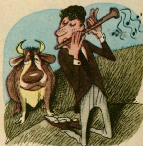
Рис. В. ЧИЖИКОВА

Откуда же берутся эти рекорды? Как Гиннес и его сотрудники, например, узнали, кто больше всех съел сосисок? Ли Ханг из Гонконга — 29 с половиной сосисок за шесть минут. Вдруг кто-то уже побил рекорд — проглотил за это же время сразу тридцать сосисок? Всё просто! Эти странные рекорды, как и положено, устанавливаются только на сорев-