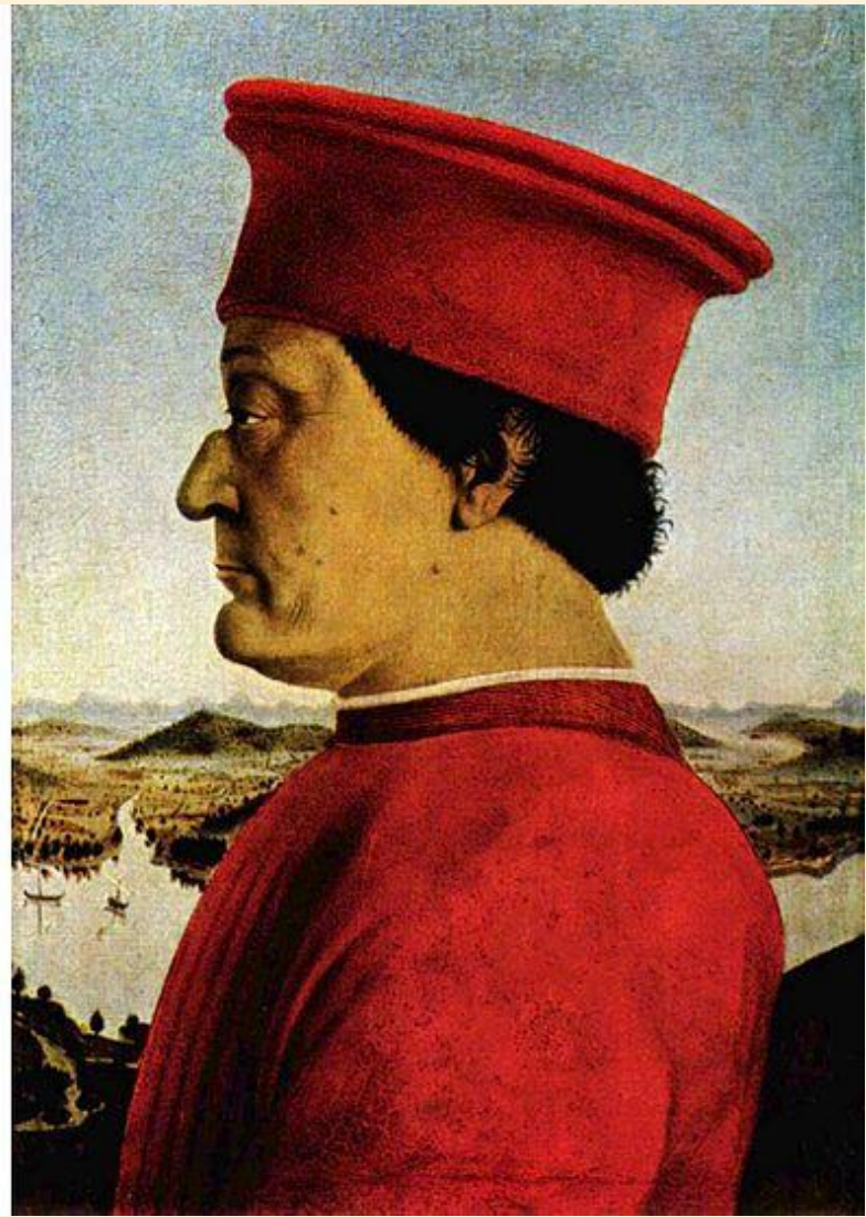
Пьеро делла Франческа. Портреты Федерико да Монтефельтро, герцога Урбинского, и его жены Баттисты Сфорца