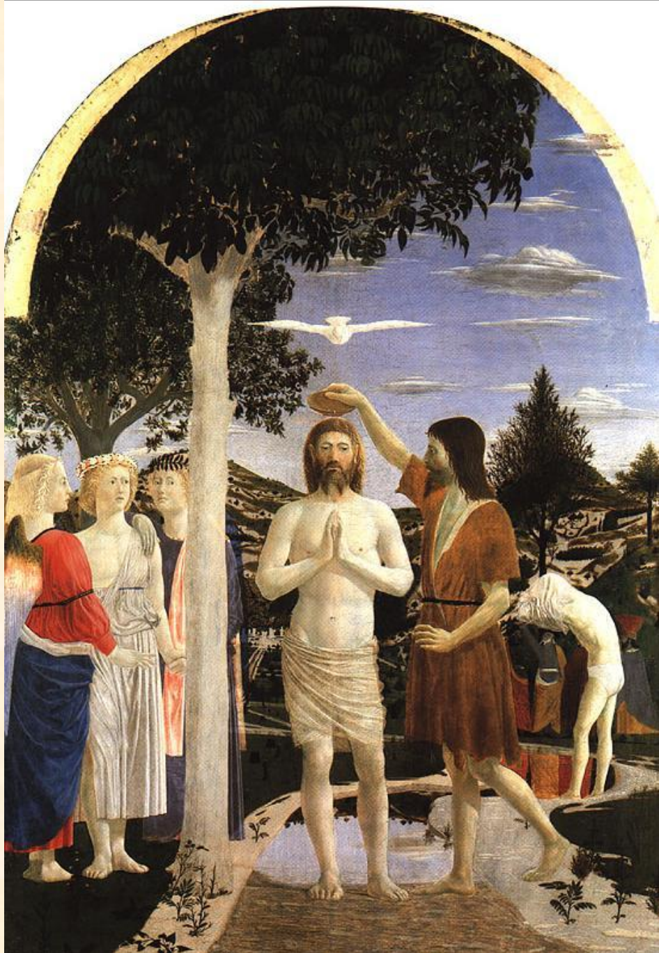
Пьеро делла Франческа «Крещение Христа»