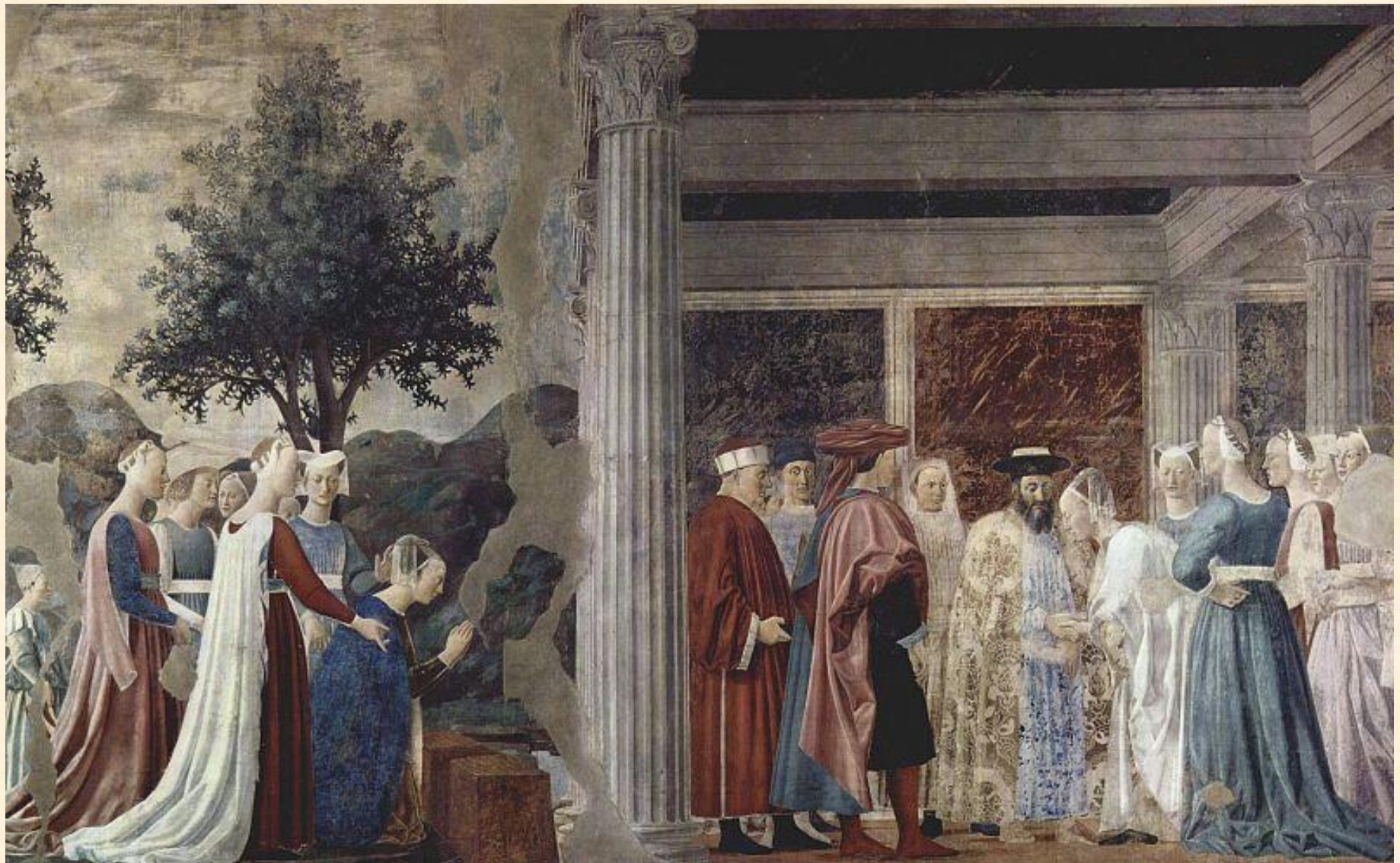
Пьеро делла Франческа. История царицы Савской. Церковь Сан Франческо. Ареццо.