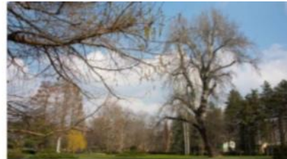
Danube Park 4,7 ★★★★★ (10 093) Парк с садами и большим прудом