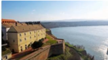
Петроврадинская крепость 4,8 ★★★★★ (21 047) Огромный форт на холме над Дунаем