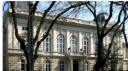
Музей Воеводины 4,7 ★★★★★ (945) Музей истории и искусства