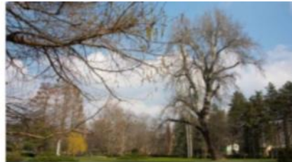
Danube Park 4,7 ★★★★★ (10 093) Парк с садами и большим прудом