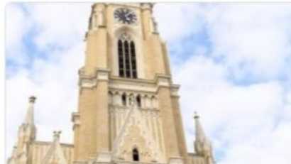
Собор Девы Марии 4,7 ★★★★★ (1 513) Крупная католическая церковь в Нови-Саде