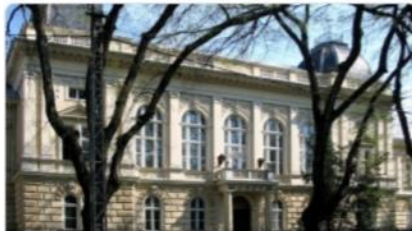
Музей Воеводины 4,7 ★★★★★ (945) Музей истории и искусства