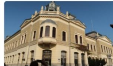
Матица сербская 4,8 ★★★★★ (148) Художественная галерея, Литература и Искусство