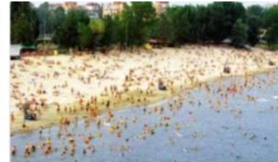
Шtrand 4,7 ★★★★★ (684) Пляж