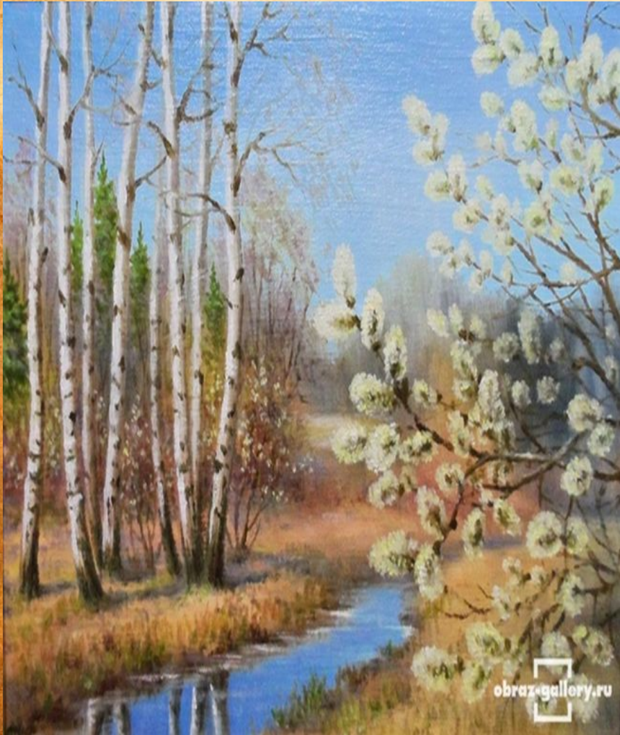
П. П. Перов «Весна ранняя».