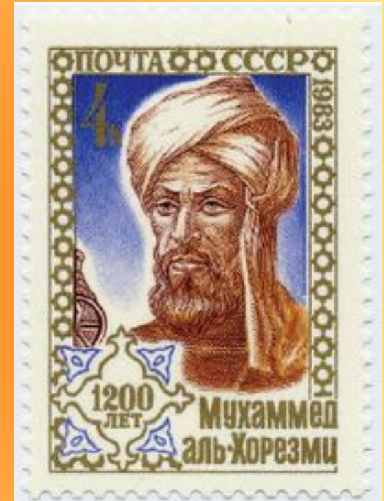
Аль-Хорезми – арабский ученый (825 г.)

Арабское название этого правила “ал-джебр” дало имя АЛГЕБРА.