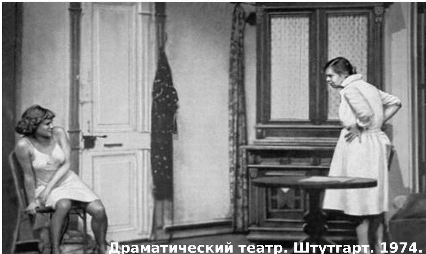
Драматический театр. Штутгарт. 1974.

Для любителей искусства открытием станут театры Штутгарта. Кстати, немецкие театры ничуть не уступают знаменитым итальянским.